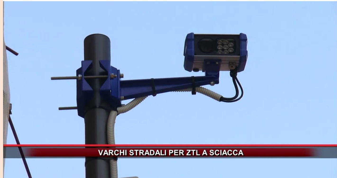
VARCHI STRADALI PER ZTL A SCIACCA

I VARCHI ZTL SONO CONTROLLATI CON SISTEMI ELETTRONICI DI ULTIMA GENERAZIONE, PRECISAMENTE TELECAMERE «ORC SART_BASIC» UNI 10772:2016, OMOLOGATA DAL MINISTERO DELLE INFRASTRUTTURE E TRASPORTI CON DECRETO N. 0358 DEL 29/10/2019.